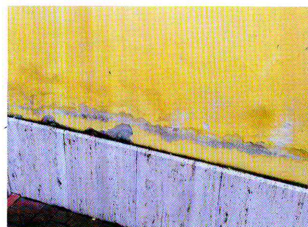
Paramento in pietra e sovrastante distacco dell'intonaco

La muffa che, come abbiamo visto ne è la conse-